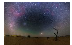
Un eclipse lunar con gegenschein