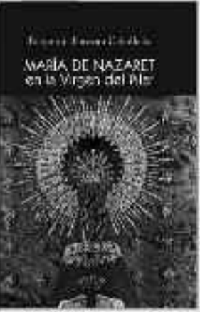
136 Páginas • 12 €