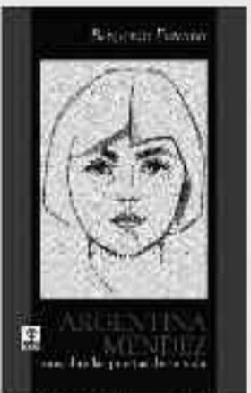
160 Páginas • 8 €