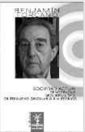
272 Páginas • 12 €