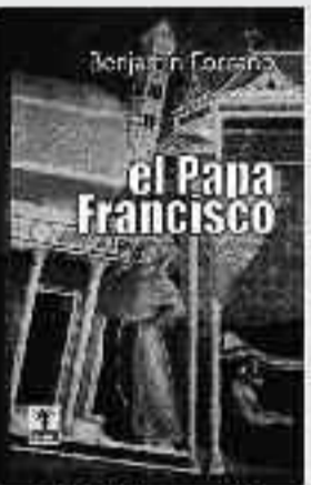
160 Páginas • 8 €