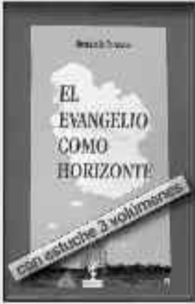
1.084 Páginas • 55 €