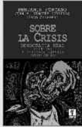
154 Páginas • 8 €