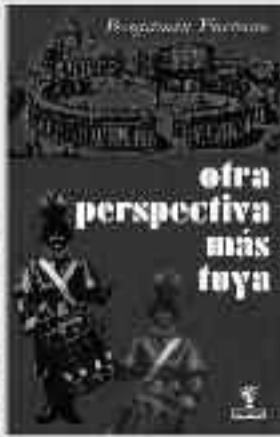
186 Páginas • 12 €