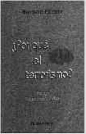
120 Páginas • 12 €