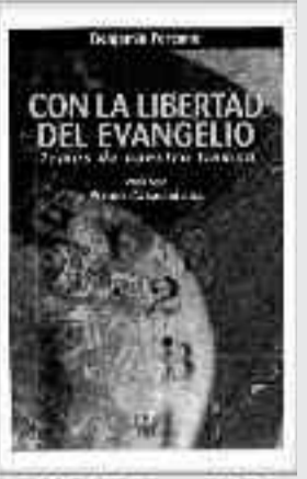
268 Páginas • 17 €