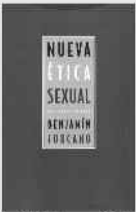
454 Páginas • 20 €