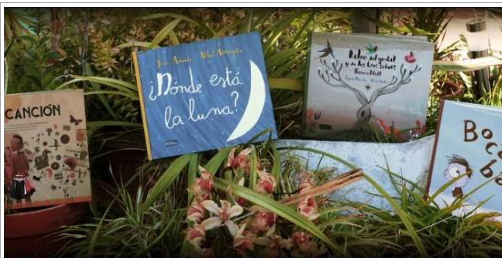
Cuatro nuevos títulos ilustrados