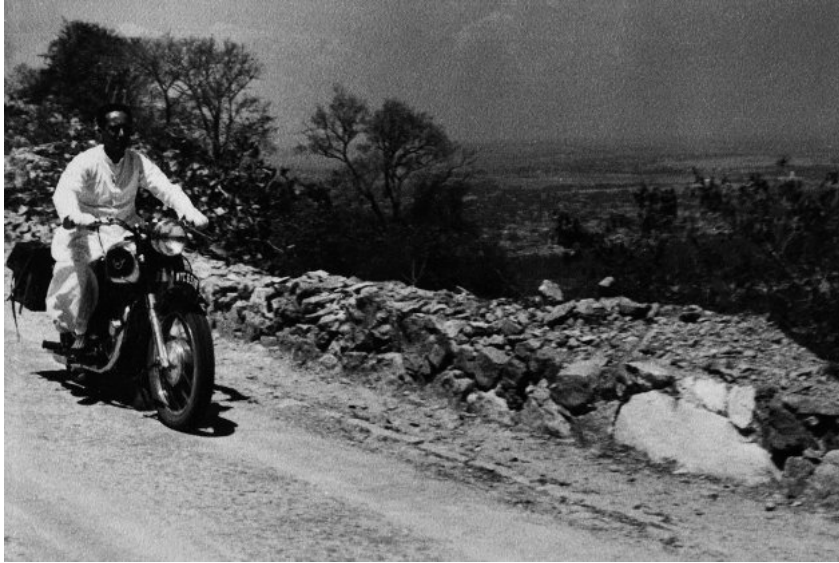
Descobrint l'Índia en moto, l'any 1957.

Finalment l'any 1966 és formalment expulsat de l'Opus Dei . Dos anys abans havia tornat a l'Índia, on s'incardina a la diòcesis de Varanasi, on resideix al costat del Ganges. A partir d'aquí, el seu prestigi acadèmic no fa altra cosa que créixer: és convidat a donar classe a Harvard i nomenat catedràtic d'estudis religiosos a la Universitat de Califòrnia, a Santa Barbàra. Establert a Tavertet a partir dels anys 80, la seva figura pública esdevé molt present gràcies a entrevistes i aparicions als mitjans de comunicació que converteixen en popular un savi d'una trajectòria acadèmica i filosòfica gairebé inabastable. Com a dada que assenyalen els comissaris, en vida de Panikkar, que va morir a Tavertet l'any 2010, es van defensar fins a 40 tesis doctorals sobre la seva obra, a més de rebre nombrosos doctorats honoris causa, condecoracions i haver impartit una de les prestigioses Gifford Lectures, un reconeixement equivalent al "Premi Nobel del pensament".