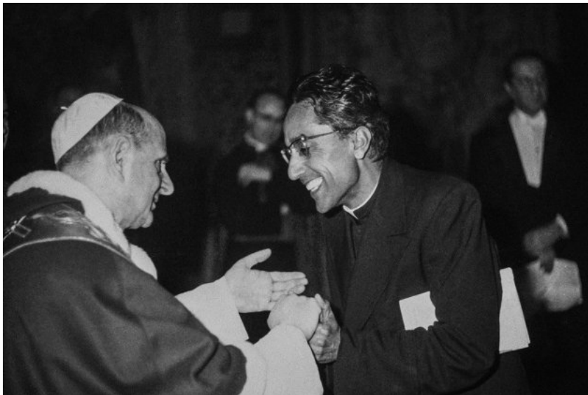
Amb el papa Pau VI a Roma, l'any 1966.

La seva llarga permanència al sí de l'Opus Dei , de 1941 al 1966, no està en cap moment exempta de moments de crisi. Des del principi és un sacerdot incòmode, amb un conflicte constant entre la seva ambició intel·lectual i acadèmica i la necessitat de l'apostolat que requereix la institució acabada de fundar. Doctorat en Ciències, Filosofia i Teologia, no encaixa a Madrid, ni a Salamanca, ni tampoc a Roma, i finalment l'any 1954 és enviat a l'Índia, el país d'origen del seu pare.