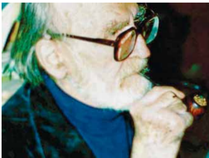
Eliade arriba en català per dos llibres

seus mètodes d'estudi, per exemple en el sistema que passa per un estadi prereflexiu i acostuma a ser holístic, orgànic i dialèctic: "El seu projecte pot