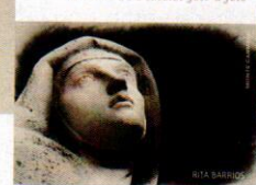
TERESA DE JESÚS 500 AÑOS El Carmelo Descalzo foto a foto