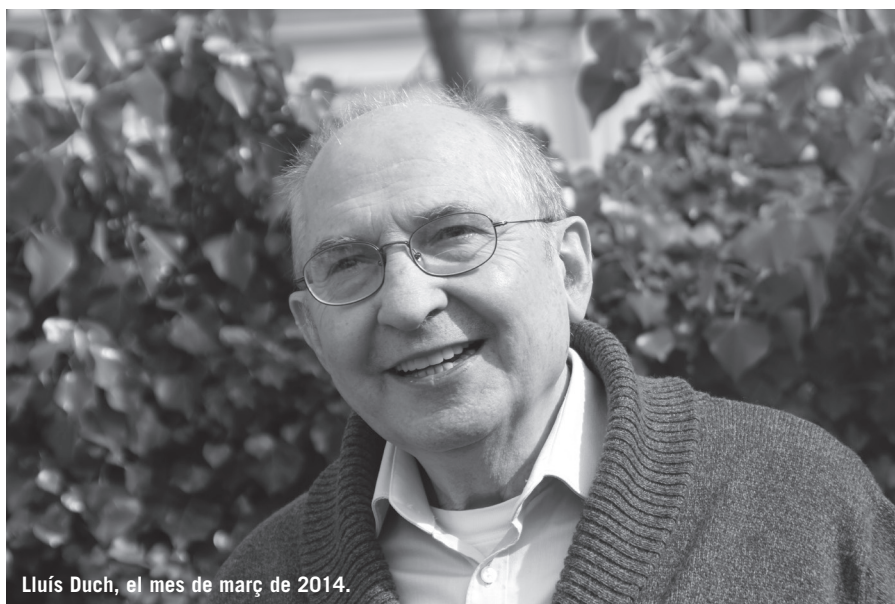
Lluís Duch, el mes de març de 2014.

Duch deixa el seu mestratge sobre el polifacetisme del llenguatge humà, la transcendència de la dimensió comunicativa i comunitària de l'ésser humà, la perspectiva ètica de la paraula i l'hermenèutica del desig. La producció antropològica que va elaborar els darrers anys li van proporcionar una notorietat que, fins a un cert punt, l'incomodava. Amb motiu del seu 75è aniversari i dels 50 anys de vida monàstica, l'editorial Fragmenta va publicar una aproximació al seu pensament ( Emparaular el món , 2011) i, el 2014, Elies Ferrer va defensar a la Universitat de Girona la primera tesi doctoral sobre l'obra duchiana («La centralitat del llenguatge en l'antropologia de Lluís Duch»). Queden per estudiar, tanmateix, les seves publicacions a Qüestions de Vida Cristiana , Serra d'Or i Studia Monastica , així com una notable col·lecció de llibres d'espiritualitat i pastoral com ara Mort i esperança , Esperança cristiana i esforç humà , Pregar en temps de crisi , Memòria dels sants o De Jerusalem a Jericó , entre altres. Algú hauria d'estudiar, també, les seves brillants introduccions a les traduccions catalanes de Luter, Müntzer, Schleiermacher, Buber, Silesius, Bonhoeffer i Schönberg. El millor homenatge que se li pot fer serà llegir el seu llibre pòstum ( Sortida del laberint ) que apareixerà publicat a finals d'aquest any. (E)