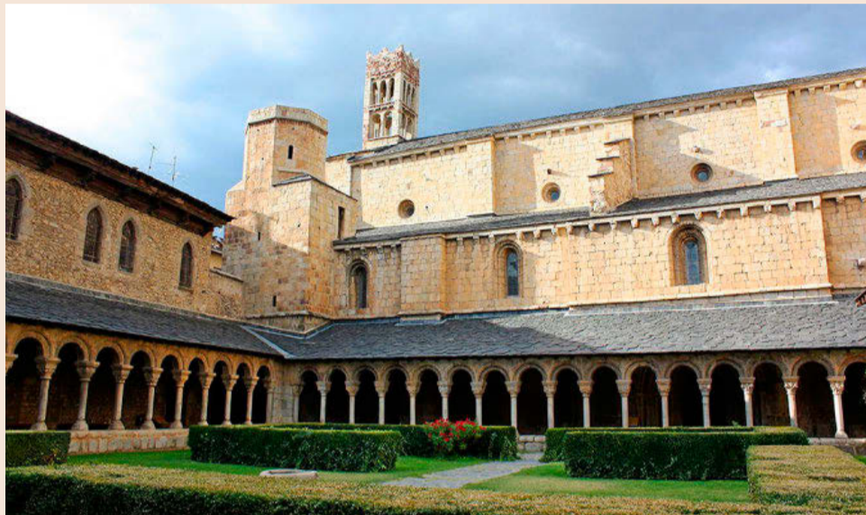
El claustro de la catedral de La Seu d'Urgell, la única de estilo románico que hay en Catalunya.

También en los Pirineos, pero a mediados de enero, acabó la restauración del pórtico de Santa Maria de Ripoll. El proceso ha durado cuatro meses y medio y ha costado 125.000 euros, aportados por la Generalitat, la Diputació de Girona y el patronato que gestiona este monasterio milenar. Los trabajos han permitido retirar parcialmente la resina que se aplicó en 1964 para frenar el deterioro de la piedra, aunque