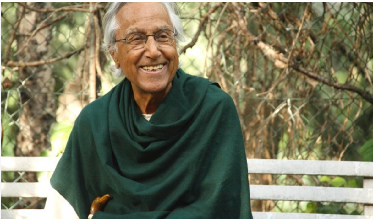
— Raimon Panikkar

Pels termes en què estan escrits els pròlegs dels seus llibres, en els quals sovint l'autor hi afirma que aquelles reflexions formen part de la seva existència al llarg de molts anys, podem apuntar que Raimon Panikkar diria que la biografia d'un home (o d'una dona, és clar) és la seva obra. I no perquè ho digui la cita evangèlica, sinó perquè és una evidència. Hem d'entendre l'obra no només com una