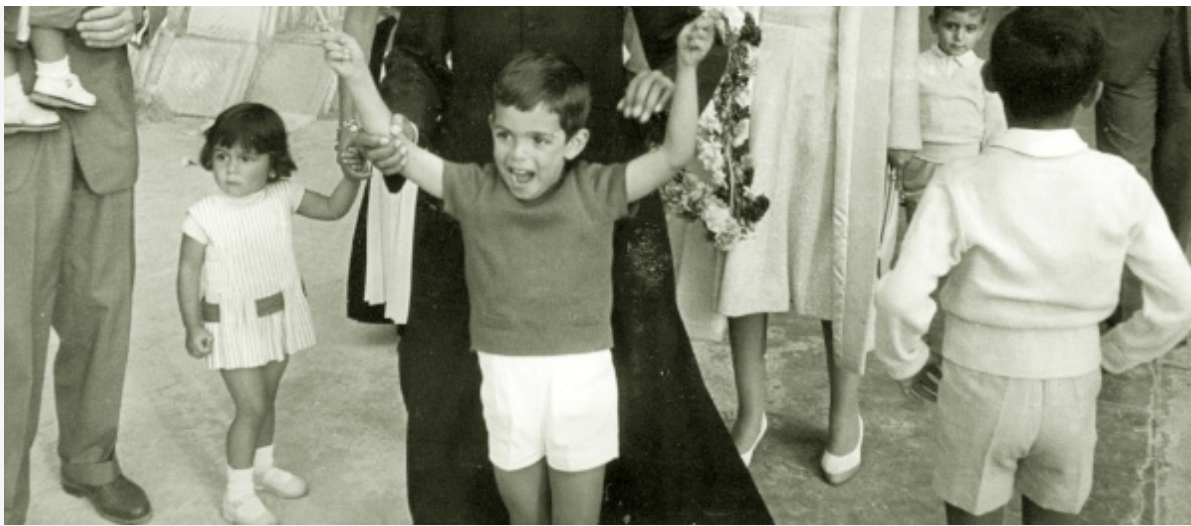
L'arribada de Raimon Panikkar de l'Índia (juny 1959)