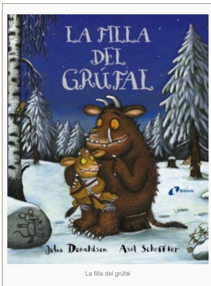
La filla del grúfal

Sabeu què és un grúfal? No n'heu vist mai cap? Té uns ullals terribles, ulls de color taronja, la llengua negra, una berruga verinosa a la punta del nas... Així ens el presenta un espavilat ratolí que intenta no ser menjat pels animals del bosc. S'edita ara un clàssic que portarà a nous lectors i lectores les seves històries. Bruñoedita ara El grúfalo . Libro con sonidos (que pot ser molt atractiu pels més petits) i La filla del grúfal (en català i castellà), de Julia Donaldson i Axel Scheffler. Pels més petits, a El grúfalo , la repetició de l'apassionant diàleg del ratolí amb cada personatge que es trobarà ens assegura l'èxit. Els més grans quedem absorts per l'enginy del ratolí i la seva capacitat de sortir-se'n i sobreviure. El missatge que els més petits, o més febles, poden evitar ser cruspits si són llestos sempre és tranquil·litzador. A la segona història, La filla del grúfal , apareix el "gran ratolí malvat" que fa molta por a la filla del grúfal que ha sortit de la cova i entrat en un món per descobrir que és el del bosc. Es recuperen els personatges de la primera història i una estructura semblant.