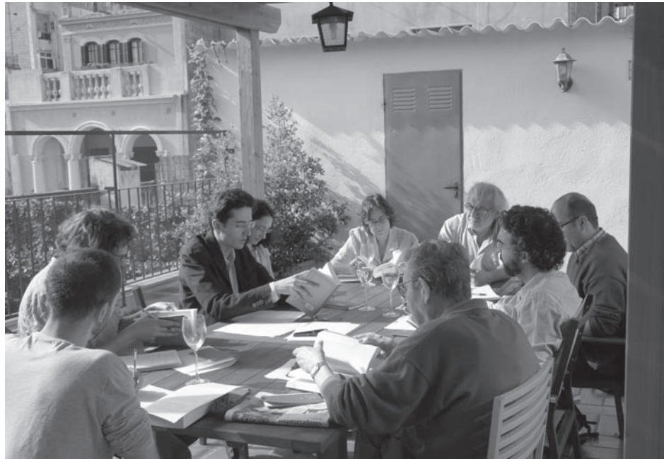
Un moment de la presentació del llibre.