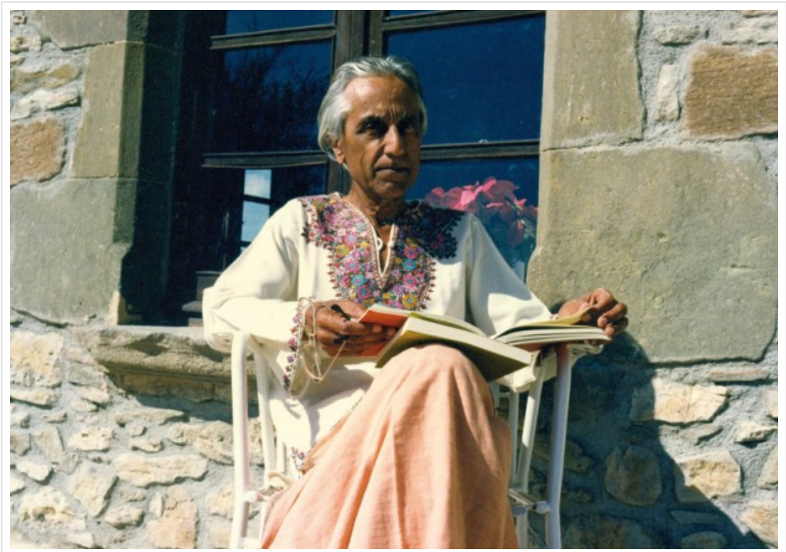
Panikkar a Can Feló, la seva residència a Tavertet, l'any 1980.

L'Any Panikkar, inaugurat el dia 5 de febrer, commemora el centenari del naixement del filòsof amb el doble objectiu difondre'n l'obra i debatre la validesa de les seves intuïcions per comprendre el món contemporani.