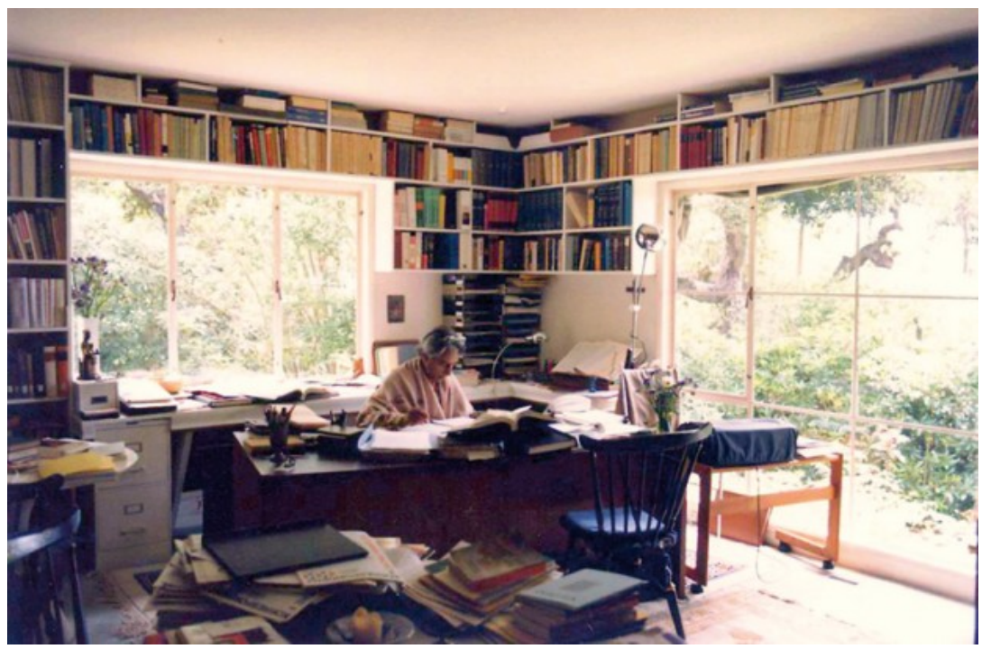
Panikkar a l'estudi de la seva casa a Santa Barbara, Califòrnia, on va ser catedràtic de filosofia comparada de les religions des de 1972.

L'any 1966 Panikkar entra en crisi amb l'Opus Dei, que l'expulsa després d'un procés canònic que coneixem cada dia millor. trasllada llavors a l'Índia i s'incardina com asacerdot a Benarés. De 1967 a 1972 imparteix docència a la Universitat de Harvard i el 1972 obté la càtedra de filosofia comparada de les religions a la Universitat de Califòrnia, a Santa Barbara. Durant els anys catedràtic divideix el seu temps entre l'Índia i els Estats Units.