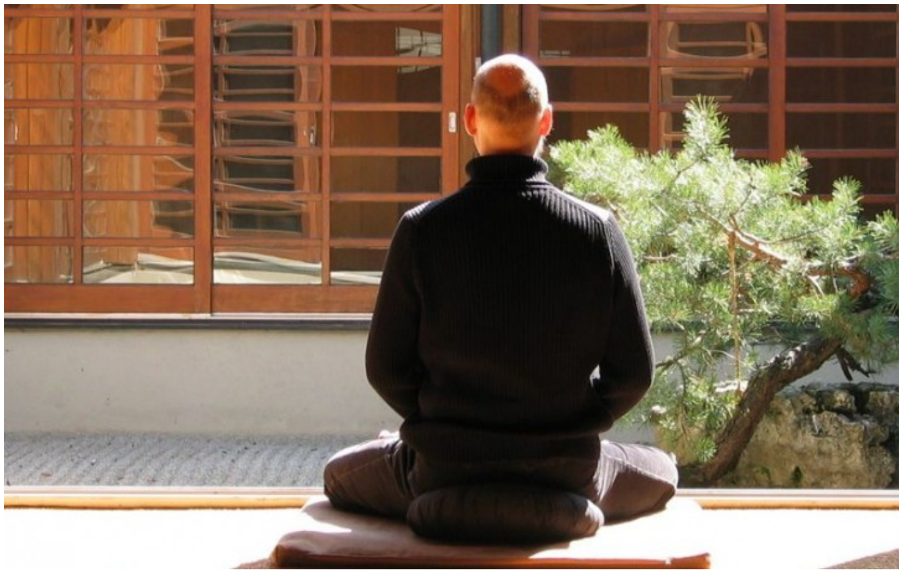
► Un hombre practica zazen

El acto tendrá lugar el jueves 14 de febrero a partir de las 19 horas