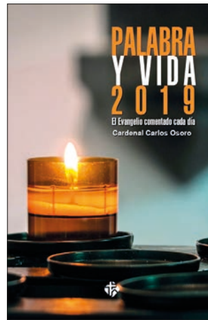
CARDENAL CARLOS OSORO Palabra y Vida 2019 Publicaciones Claretianas, 2018, 432 pág.