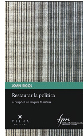
JOAN RIGOL Restaurar la política Viena-Fundación Joan Maragall, 2018, 262 pág.

Este libro quiere ser como un pequeño evangelio que podemos llevar siempre en el bolsillo para que la Palabra del Señor habite siempre en nuestro corazón. El cardenal Carlos Osoro ha comentado el texto del evangelio de cada día con reflexiones muy cercanas a la vida diaria de los hombres y mujeres de hoy, que nos ayudarán a rezar y a vivir en clave evangélica.