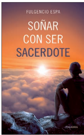
FULGENCIO ESPA Soñar con ser sacerdote Palabra, 2020, 126 pág.

Se sueña con ser artista o futbolista, pero, ¿soñar con ser sacerdote? Claro que sí, y no solo eso: soñar con tener un amigo o un familiar sacerdote. El sacerdocio es un sueño porque habla de traer a Dios a la tierra: su caridad, su amor sin límites, su presencia llena de misericordia y de perdón. Ser sacerdote es un sueño y un don. Este libro quiere ser una ayuda para los que sienten esa inquietud interior.