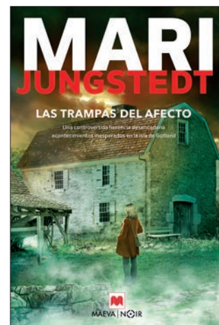
MARI JUNGSTEDT Las trampas del afecto Maeva, 2020, 362 pág.

Tres amigos vuelven a encontrarse después de casi dos décadas. Hoy solo les une la tristeza por la muerte del cuarto miembro del grupo, convertido en los últimos años en una de las nuevas voces de la literatura brasileña. Los recuerdos del pasado regresarán para esbozar el retrato incierto del amigo perdido y de un grupo de jóvenes que tuvieron que reinventarse en la redes sociales.