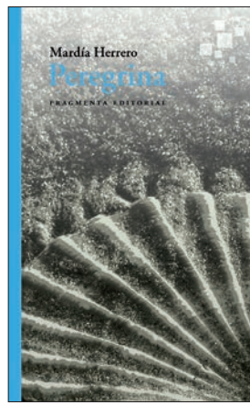
MARDÍA HERRERO Peregrina Fragmenta, 2020, 268 pág.

Se sueña con ser artista o futbolista, pero, ¿soñar con ser sacerdote? Claro que sí, y no solo eso: soñar con tener un amigo o un familiar sacerdote. El sacerdocio es un sueño porque habla de traer a Dios a la tierra: su caridad, su amor sin límites, su presencia llena de misericordia y de perdón. Ser sacerdote es un sueño y un don. Este libro quiere ser una ayuda para los que sienten esa inquietud interior.