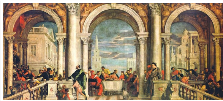
— 'Cena a casa di Levi', del pintor Paolo Caliari, 'Il Veronese'.