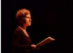
Barcelona Poesia: poesia contra tot