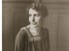
Freud i el 155