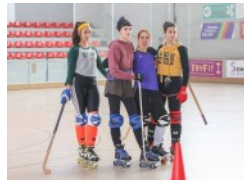
Les de l'hoquei. Una sèrie cridada a ... important important