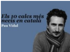
Els 10 cales més necis en català