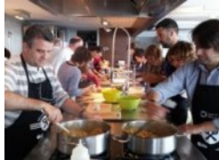
De què s'alimenta un museu?