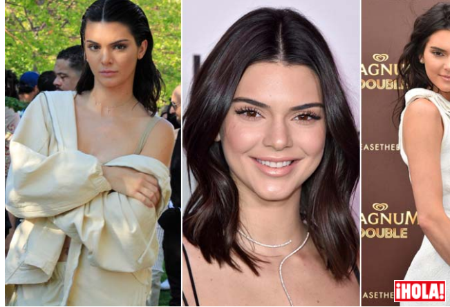
Ocho mascarillas caseras para lucir una piel perfecta como Kendall Jenner ( http://www.hola.com/belleza/caraycuerpo/2017032792781/kendall-jenner-mascarillas-naturales-piel-rj/?utm_source=lavanguardia&utm_medium=referral )

Lamentables incidentes en el Andorra-Prat de juveniles ( http://www.mundodeportivo.com/futbol/futbol-catala/20170327/421219811283/lamentables-incidentes-en-el-andorra-prat-de-juveniles.html )