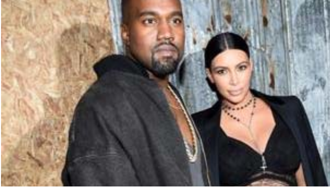
Kim Kardashian y Kanye West, rotos de dolor ( http://www.lavanguardia.com/gente/20170327/421232311180/kim-kardashian-kanye-west-dolor.html )