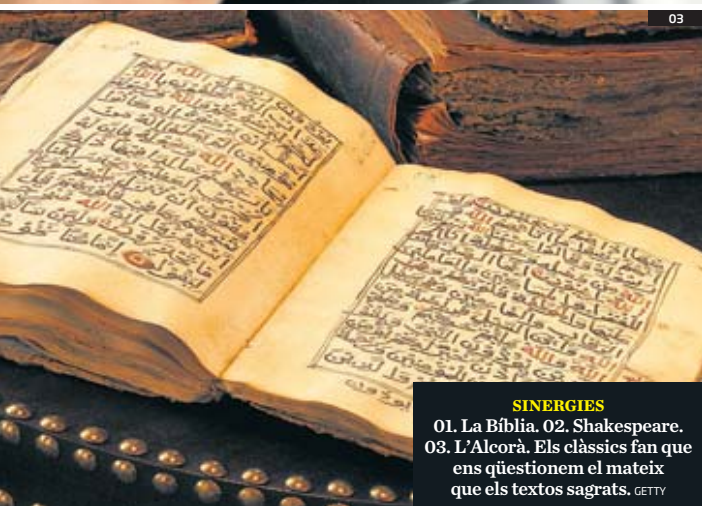
SINERGIES 01. La Bíblia. 02. Shakespeare. 03. L'Alcorà. Els clàssics fan que ens qüestionem el mateix que els textos sagrats.