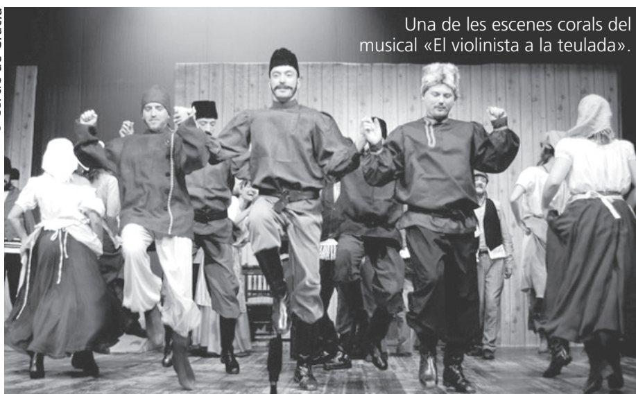
Una de les escenes corals del musical «El violinista a la teulada».

Ben poques generacions hi deu haver que desconeguim una de les cançons provinents del teatre musical de Broadway més populars dels últims cinquanta anys: If I were a rich man ( Ai, si jo fos ric! ), l'estrella del musical Fiddler on the Roof ( El violinista a la teulada ), divulgada a partir de la versió cinematogràfica del 1971, dirigida per Norman Jewison, que va comptar amb el doblatge, a la interpretació musical, del cèlebre violinista Isaac Stern.