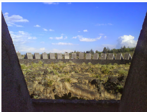
Espacio Escultórico, en la UNAM (México D. F.)

Pertinentes o no, las notas de este blog quieren ser una manera de mirar el mundo, de comentarlo y, ¿por qué no?, también de tratar de incidir en él. Se centran en el mundo de la edición, de la investigación, de la literatura, de la cultura y de las religiones.