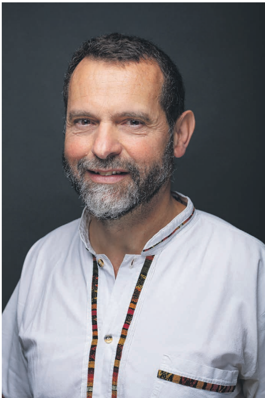
Xavier Melloni (Barcelona, 1962) és teòleg, antropòleg i fenomenòleg de les religions.

«Anar descalç significa caminar més atentament, per no fer-se mal ni fer mal als altres; anar lliure de prejudicis, per entrar en la terra sagrada de l'altre»