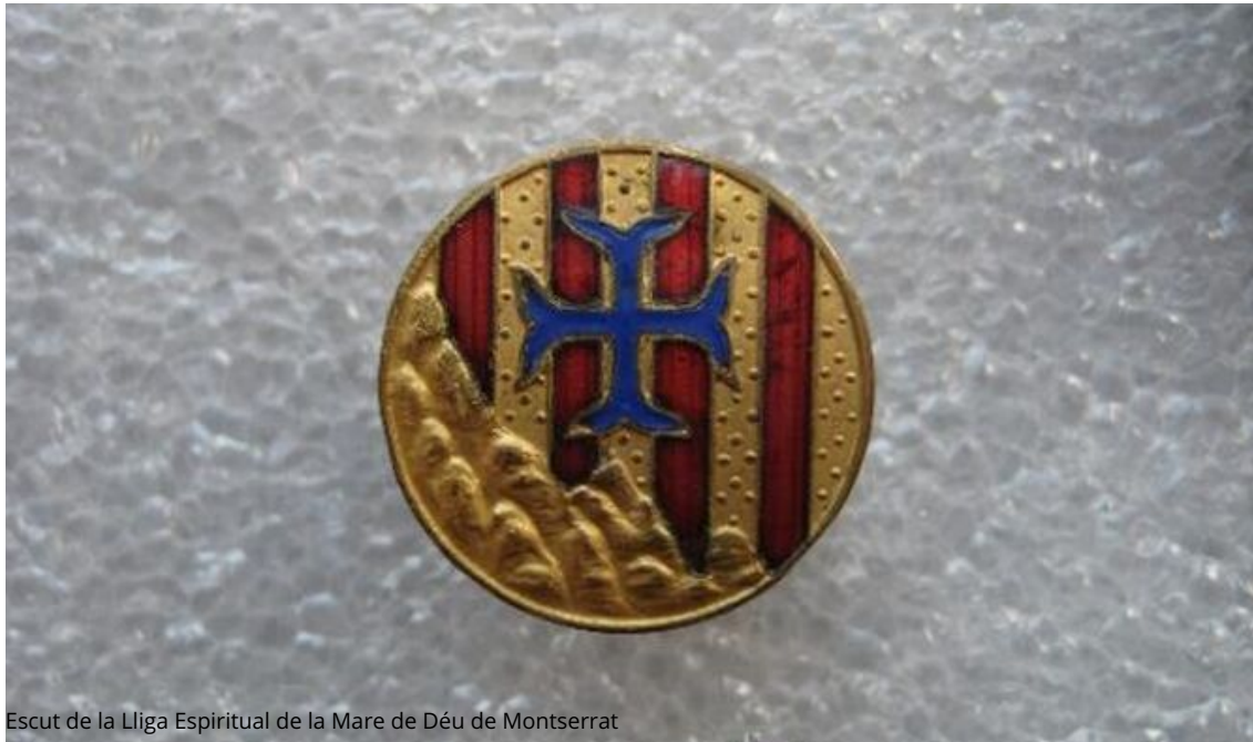
Escut de la Lliga Espiritual de la Mare de Déu de Montserrat