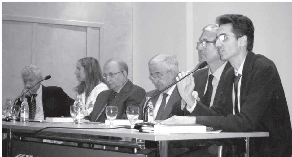
Ponents rellevants del món de la cultura i la comunicació hi van participar.