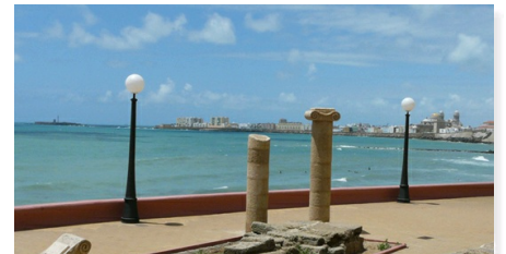
Revista nº 42, gener-abril 2012