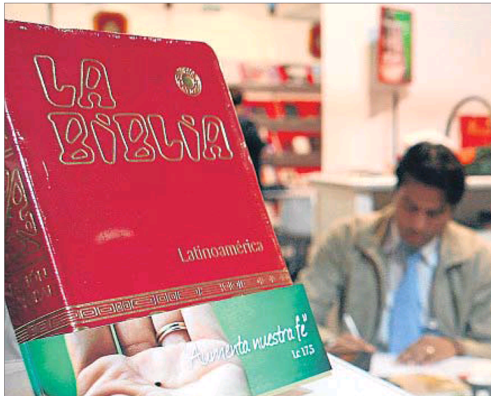
La Bíblia per a Llatinoamèrica de l'editorial Verbo Divino, en un estand de llibre religiós al Lliber