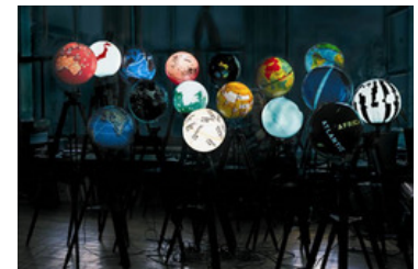
World Processor. Fotografía de la instalación de Ingo Gunther. En Big Bang Data (CCCB)