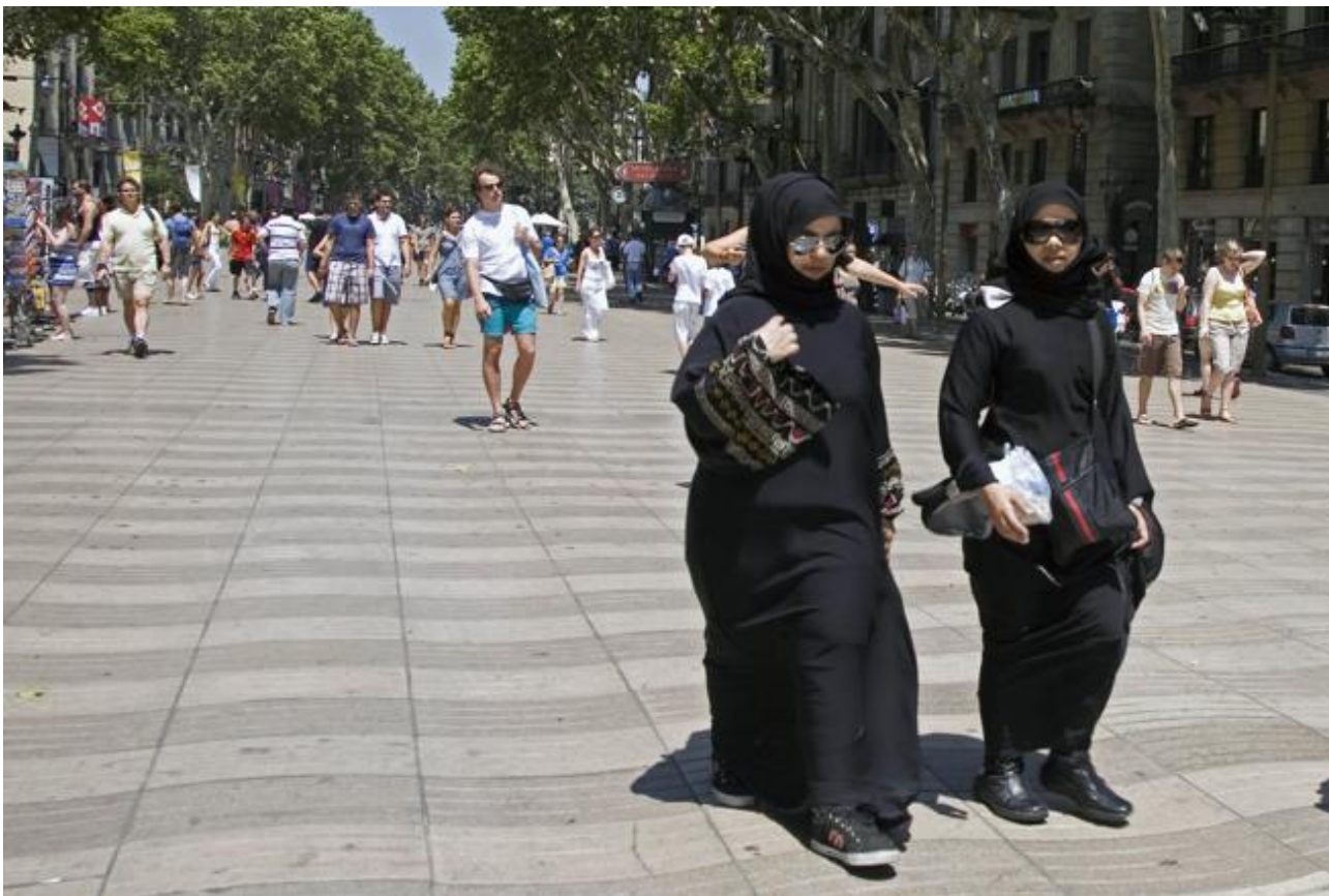
Dos turistas islámicas fotografiadas paseando por Rambla Catalunya