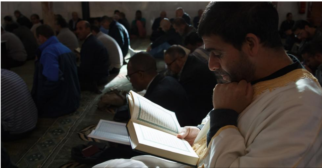
Un hombre lee el Corán en el Centro Cultural Islámico de la Mezquita de Madrid (Dani Duch)