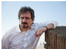
Albert Sánchez Piñol. Quan érem genocides