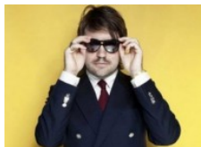
Albert Serra no és al·lucinogen, és al·lucinogeni