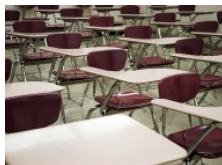
L'escola pública en mans de la concertada. En comencem a...