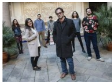
Puja a Núvol