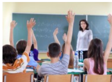
No ens emboliquem en falsos debats