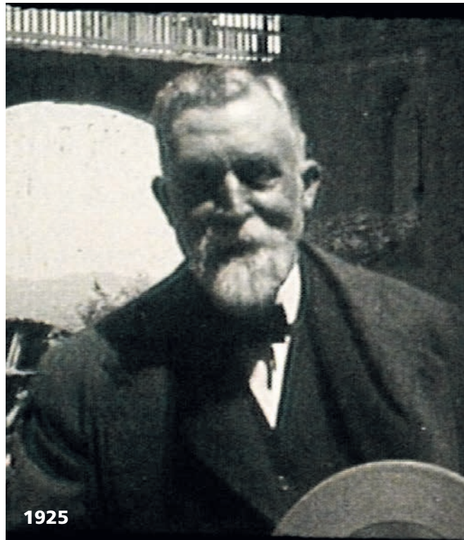
Fotograma de la persona atribuïda a Gaudí, segons el documental de TV3.

2.- El senyor que a la filmació avança cap a la càmera, confiat i somrient, és un personatge alt i corpulent, ele-