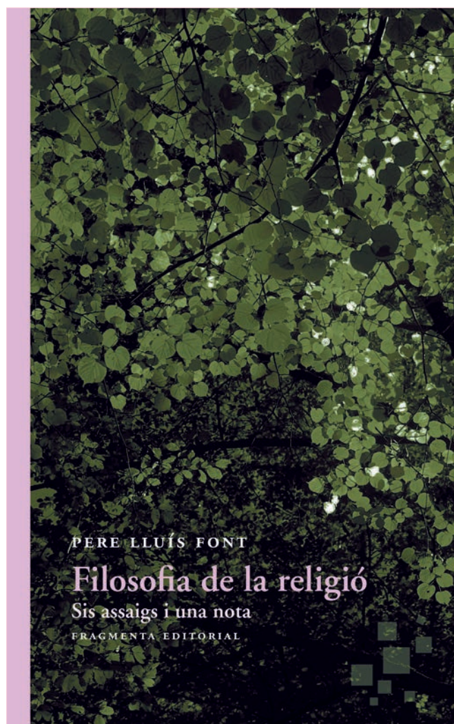
«Filosofia de la religió. Sis assaigs i una nota » (Fragmenta Editorial).

La religió, si no és viscuda, no és res, però ahora ha de tenir la possibilitat de ser pensada i assumida intel·lectualment