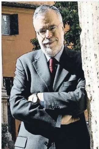
Andrea Riccardi, fundador de Sant Egidí