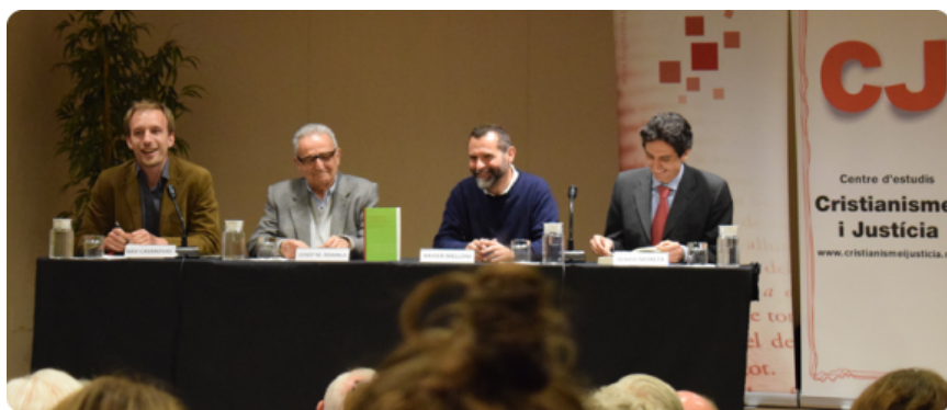
Presentació del llibre dels Exercicis Espirituals a Barcelona