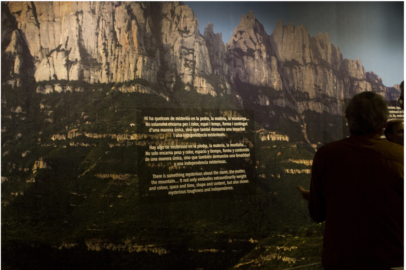
'Kosmos Panikkar' | Palau Robert