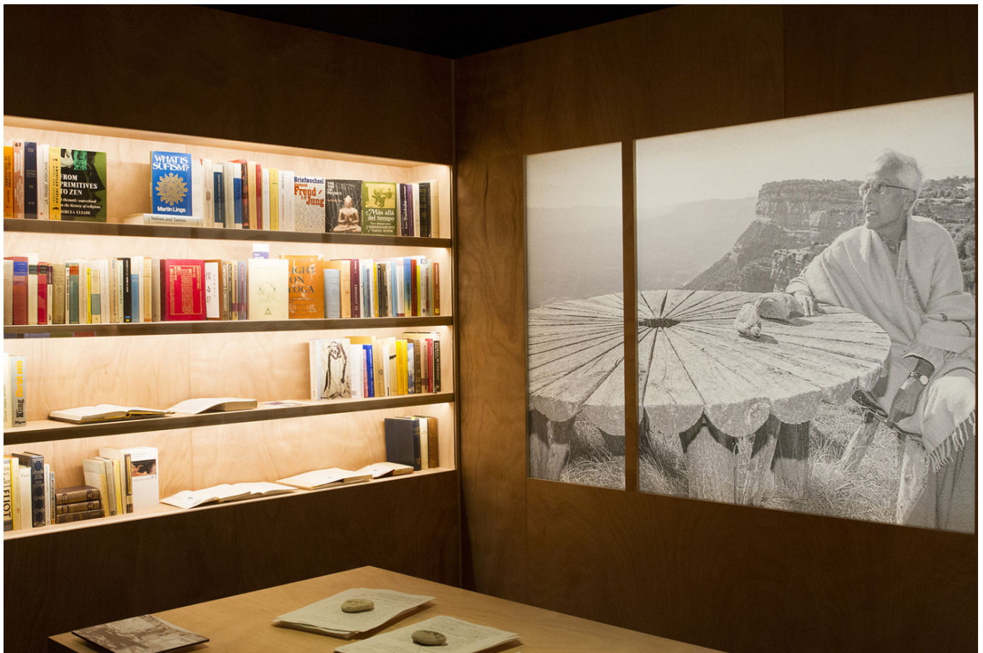
'Kosmos Panikkar' | Palau Robert

Precisament, aquest 2 de novembre, dia del centenari del naixement de Panikkar , es posa a la venda el llibre-catàleg de l'exposició El món de Raimon Panikkar: una mirada integradora , que es podrà adquirir a l'Oficina de Turisme i a les llibreries. La publicació es presentarà durant el mes de novembre al Palau Robert.