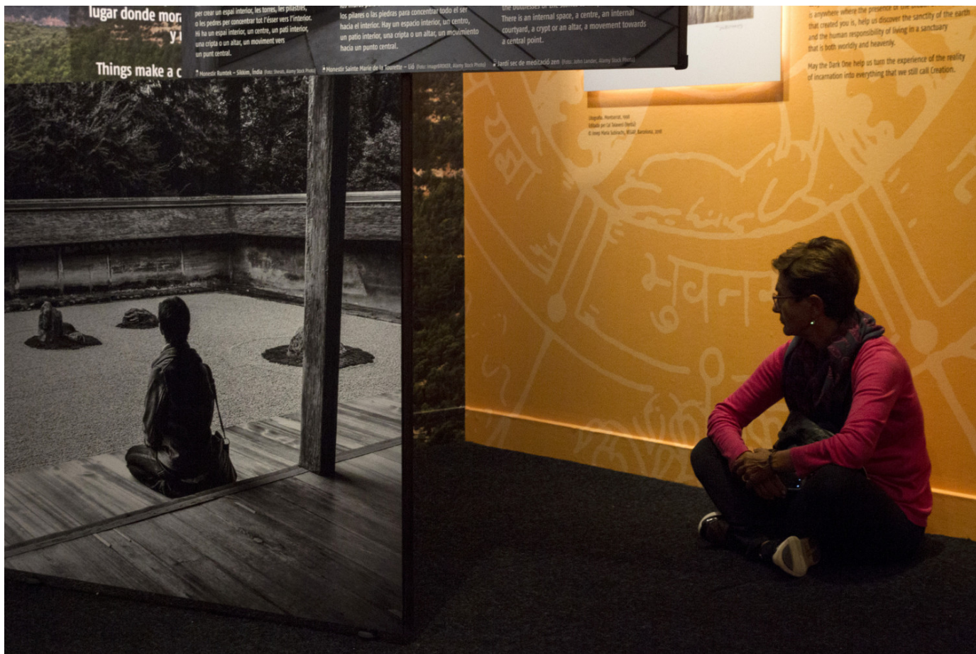
'Kosmos Panikkar' | Palau Robert

Subscriu-te (subscripcions) a El Temps i tindràs accés il·limitat a tots els continguts.