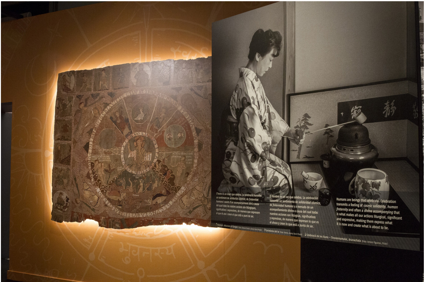
'Kosmos Panikkar' | Palau Robert