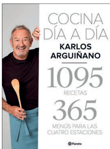
KARLOS ARGUIÑANO Cocina día a día Planeta, 2019, 789 pàg.

No tot es pot dir. No tot es pot representar. Potser el desgast semàntic al voltant de la paraula Déu té a veure amb la insaciabilitat del llenguatge, que ha intentat dir massa, que ha intentat dir-ho tot. Els assajos breus que formen aquest llibre parteixen de la convicció que al voltant de la idea de Déu caldria deixar un gran espai de silenci protector.