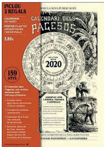
Calendari dels pagesos 2020 Publicacions Tomàs, 2019, 43 pàg.

En aquest almanac hi trobareu informació agrícola, astronòmica i sobre la cultura i les tradicions catalanes. També inclou articles d'actualitat, un calendari de pràctiques agrícoles, el santoral i les dates de les fires, mercats setmanals i festes majors de tots els municipis de Catalunya. S'edita, ininterrompudament, des de l'any 1861.