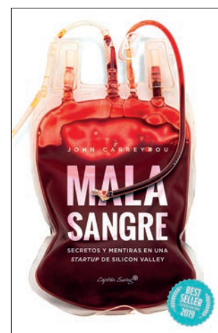
JOHN CARREYROU Mala sangre Capitán Swing, 2019, 376 pàg.

L'agost del 2005, molt abans dels crims que van commocionar la vall del Baztan, una jove Amaia Salazar de vint-i-cinc anys, subinspectora de la Policia Foral, participa en un curs d'intercanvi per a policies de l'Europol a l'Acadèmia de l'FBI, als Estats Units, que imparteix Aloisius Dupree, cap de la unitat d'investigació. Una novel·la trepidant que emociona i deixa sense alè.