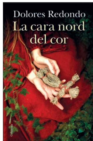
DOLORES REDONDO La cara nord del cor Columna, 2019, 686 pàg.

Cada vegada tenim menys temps per pensar què farem per dinar. Per això i perquè donar idees per a una bona alimentació sempre ha estat un dels propòsits principals, Karlos Arguiñano ens ofereix un receptari amb 365 menús complets. Un per a cada dia de l'any. 1095 receptes dividides per estacions i que posen l'accent en els productes frescos i de temporada.