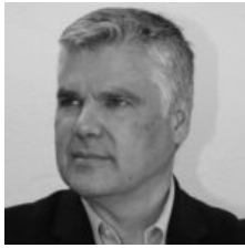
Josep Otón

la convicción de que no hay ninguna ruptura entre la Weil revolucionaria y comprometida con la lucha obrera y la Weil dedicada a la búsqueda religiosa.