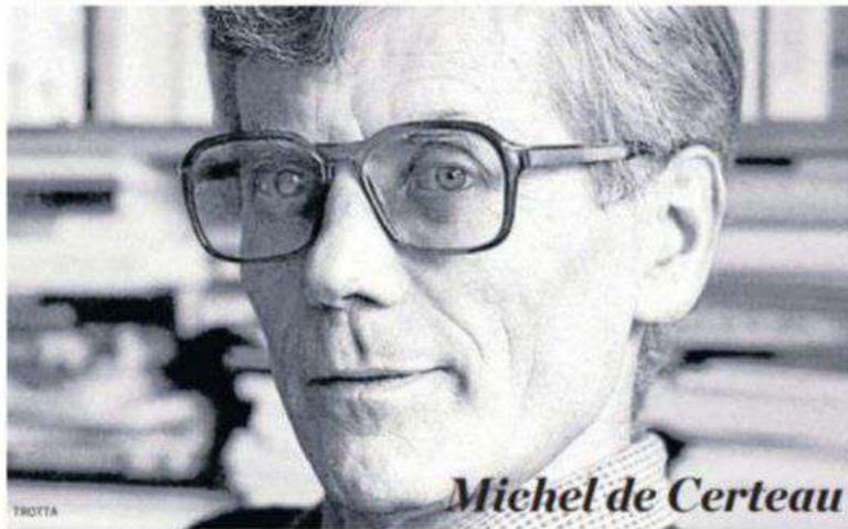
Michel de Certeau

lats evangèlics des d'una perspectiva antropològica dona a llum les seves teories sobre el desig mimètic i les violències col·lectives, mentre que De Certeau se centra en l'estudi de la mística cristiana dels segles XVI i XVII i la combina, per a sorpresa de molts en aquell París previ al Maig del 68, amb el seu interès per la psicoanàlisi. Un interès que va més enllà del vagareig intel·lectual: funda, juntament amb Jacques Lacan, l'Escola Freudiana de París. La seva reflexió sobre la vida espiritual associada a caminar beu d'aquestes fonts diverses: "A l'aturar-nos en una etapa de la vida espiritual, al voler quedar-nos-hi, ens