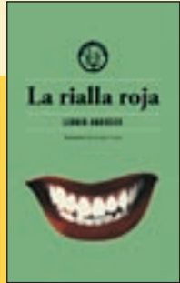
'La rialla roja' Leonid Andréiev Ed. Males Herbes

Hi ha qui diu que és una de les novel·les antibel·licistes més importants que mai s'han escrit. El seu autor ho va fer durant la guerra entre Rússia i el Japó de principis de l'any 1904. Però l'autor no ho concreta mai, i així es converteix en universal. El protagonista, ferit al camp de batalla, és retornat a casa, però ni allà no pot oblidar l'horror.