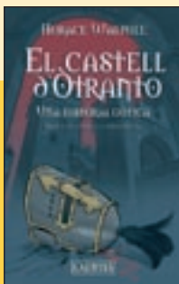
'El castell d'Otranto' Horace Walpole Ed. Laertes

Hi ha qui diu que és una de les novel·les antibel·licistes més importants que mai s'han escrit. El seu autor ho va fer durant la guerra entre Rússia i el Japó de principis de l'any 1904. Però l'autor no ho concreta mai, i així es converteix en universal. El protagonista, ferit al camp de batalla, és retornat a casa, però ni allà no pot oblidar l'horror.