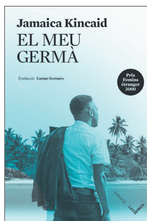
JAMAICA KINCAID El meu germà Les Hores, 2022, 144 pág.

En esta novela, un poema es el vehículo que transporta al autor hasta el niño de diez años que fue en un pueblo rural de la postguerra. La aventura se convierte en una bellísima reconstrucción del pasado desaparecido, pero también en la indagación de unos hechos que trastornaron al pueblo en una época mortificada.