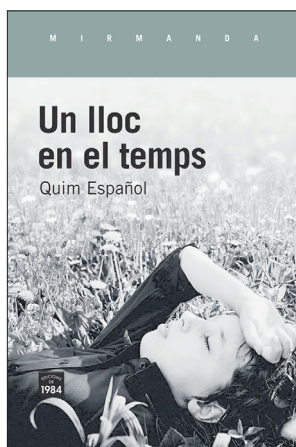
QUIM ESPAÑOL Un lloc en el temps Edicions de 1984, 2022, 224 pág.

Adriana Cavarero cuestiona que la rectitud sea la postura propia del ser humano y defiende otra, la de la inclinación, que tradicionalmente el arte y la filosofía han reservado a la mujer. Una obra fundamental no solo para el pensamiento feminista moderno, sino para la filosofía occidental contemporánea.