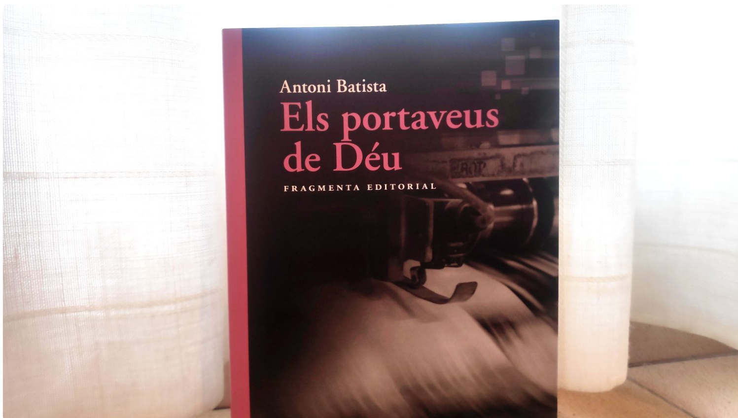
Coberta de 'Els portaveus de Déu' (Fragmenta)