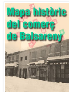
Mapa històric de comerços de Balsareny