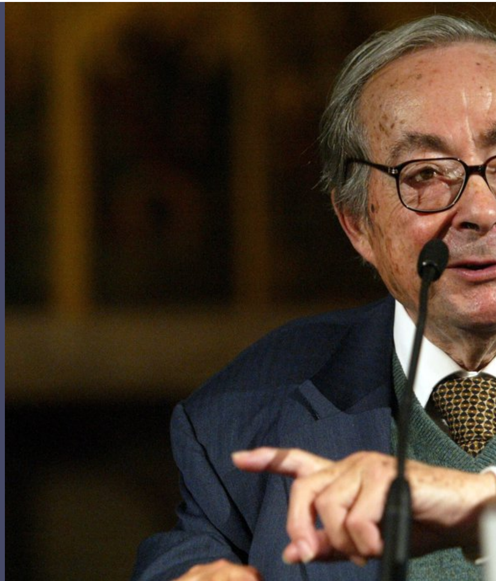
George Steiner, a Barcelona, el 2007