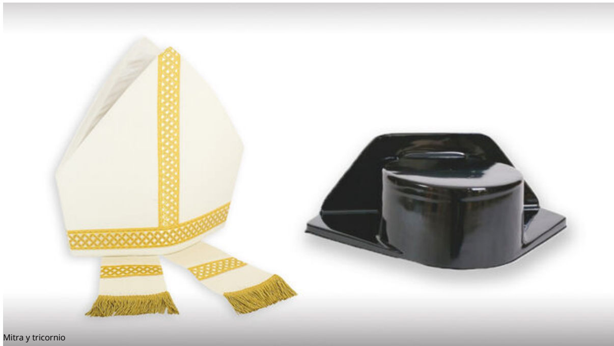
Mitra y tricornio

Y lo primero que hay que destacar es que, tanto "mitra", como "tricornio" , en la elaboración-formulación de su etimología, tuvieron mucho que ver con los "cuernos" . En las culturas- todas ellas "religiosizadas"-, los cuernos se encuentran presentes y activos con legitimidad y sin reparo humano o divino de ninguna condición o clase.