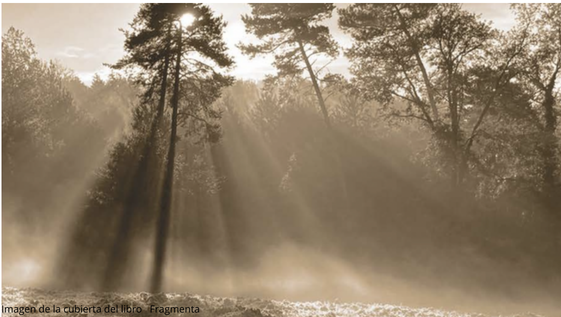
Imagen de la cubierta del libro - Fragmenta