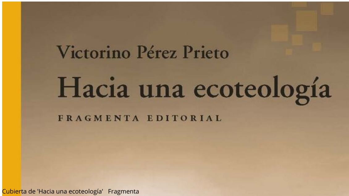
Cubierta de 'Hacia una ecoteología' Fragmenta

El libro está distribuido en cinco capítulos de desigual extensión. Tras una Introducción que animo encarecidamente a leer (“Complejidad y ecosofía. La realidad como un tejido sin costuras frente a una perspectiva fragmentaria”, cap. I), viene el cap. II “Ciencia y Filosofía de la complejidad”, en el que le dedico un espacio más amplio a Edgard Morin y Raimon Panikkar , dos genios del siglo XX que he tenido la fortuna y el regalo de conocer; sobre todo el último, maestro y amigo. Luego “Ecologismo e interrelacionalidad en la Biblia y en las otras religiones y culturas” (cap. III); y “La fe cristiana verde traicionada. La teología y las iglesias ante el desafío ecológico. El papa Francisco y la encíclica Laudato si ” (cap. IV). Finalmente “Hacia una ecoteología y una ecoespiritualidad [ecosófica y no-dual]” (cap. V), aprendiendo de tres grandes místicos: Francisco de Asís , Juan de la Cruz y Pierre Teilhard de Chardin .