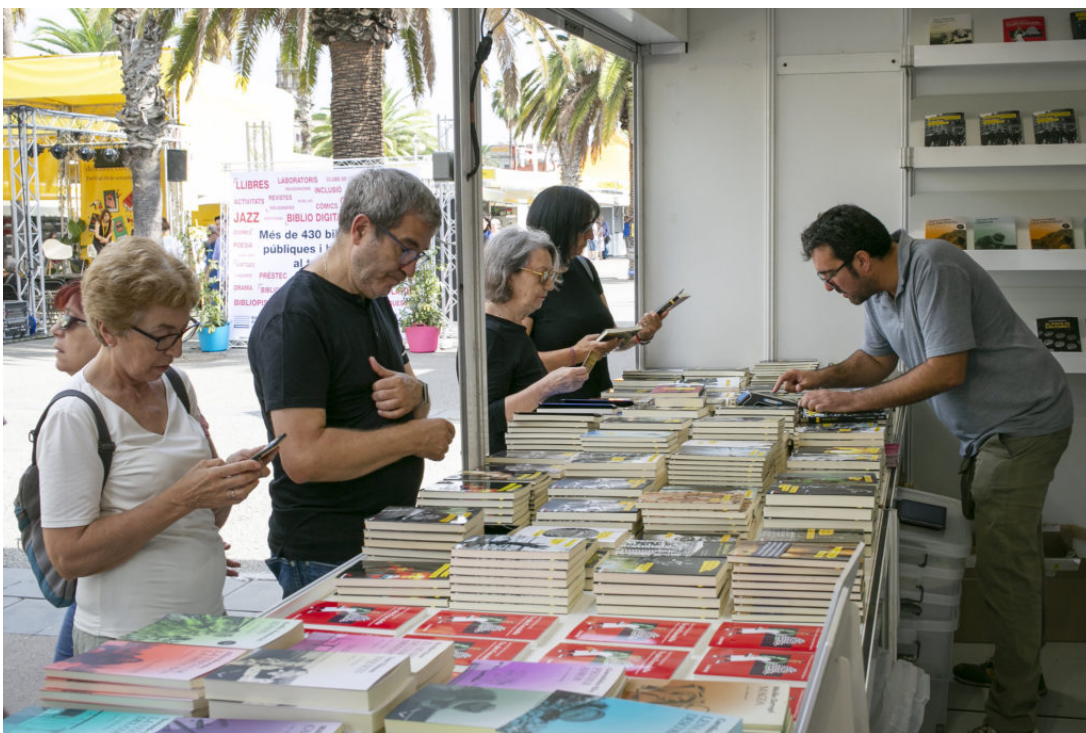
La Setmana del Llibre en Català

La Setmana del Llibre en Català inaugura la represa literària amb una fira que se celebrarà del 8 al 17 de setembre al Moll de la Fusta de Barcelona. Segons l'organització, es tractarà de l'edició més gran de les quaranta realitzades fins al moment, amb 7.000 m 2 d'espai disponible, i comptarà amb 87 casetes, 287 expositors i 125 novetats editorials. Entre aquestes últimes n'hi haurà un grapat que enceten o amplien biblioteques literàries de tota classe i temàtiques, de la literatura de gènere a la narrativa eròtica, passant per l'assaig, l'humor lletraferit, l'àlbum il·lustrat o la filosofia. Vet aquí una selecció de nous segells i col·leccions nascuts darrerament que trobareu en la 41a edició de la Setmana del Llibre en Català: