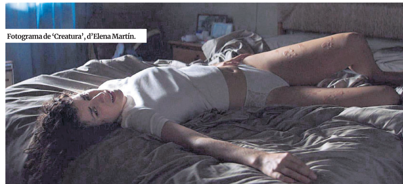
Fotograma de 'Creatura', d'Elena Martín.