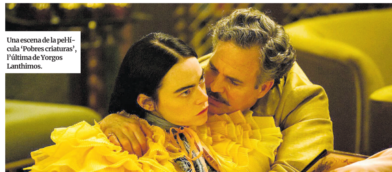
Una escena de la pel·lícula 'Pobres criaturas', l'última de Yorgos Lanthimos.