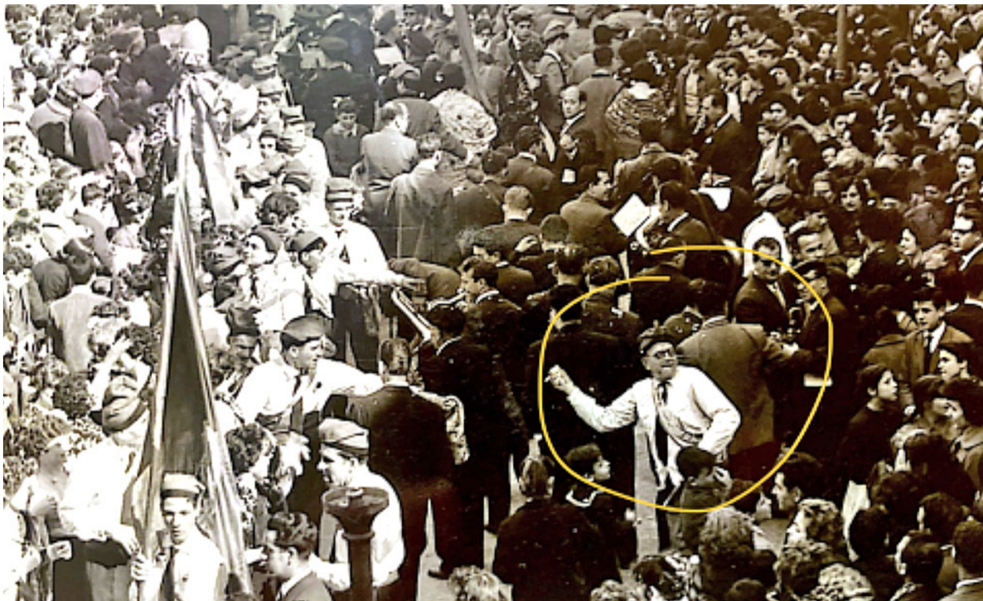
Les Comparses, any 1957. Circa

Aquesta formidable vàlvula d'escapament que era -i encara és- el Carnaval fa anys que trontolla a Vilanova