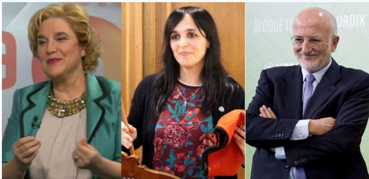
Pilar Rahola, Sílvia Orriols i Juan Roig

Els membres de la redacció de CRÍTIC tornem a personalitzar les nostres recomanacions literàries per segon Sant Jordi consecutiu. Hem escollit llibres amb sentit crític i de denúncia