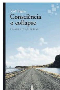
Jordi Pígem Consciència o col·lapse Conciencia o colapso Fragmenta Editorial 192 pàgines 19,50 euros

Al costat d'aquesta ment algorítmica, vinculada a una raó purament instrumental o conceptual, trobem una "ment holística", complementària, encara que progressivament desterrada, vinculada a una "raó intuïtiva" i que contempla i comprèn la vida com un tot dinàmic i in-