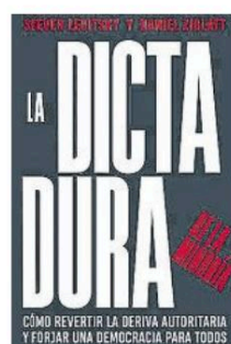
Steven Levitsky i Daniel Ziblatt La dictadura de la minoria Traducció de G. Gómez Sesé Ariel 394 pàgines 23,65 euros

Els demòcrates lleials condemnen sense ambigüitats la violència política, així com altres conductes antidemocràtiques, encara que les cometin grups